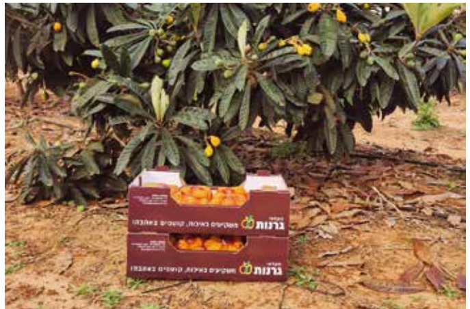
קטיף שסק ראשון שפיים 2024

אנחנו אוהבים לייבוא, בנינויה אנחנו הוכחנו ושיבנו ל האופים באהבה וללא