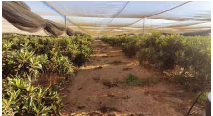
מטע השסק הצעיר 2024

העונה החולפת היתה העונה הראשונה של הנבת הפרי על העצים הצעירים. נראה שהמטע מסתגל יפה לתנאי הסביבה החולית שלנו ומגודל גם הוא תחת בית רשת. ייתכן שהשסק יכול להיות בהמשך חלופה ראויה לבננות, ככל ונצליח גם לשווק במחיר ראוי.