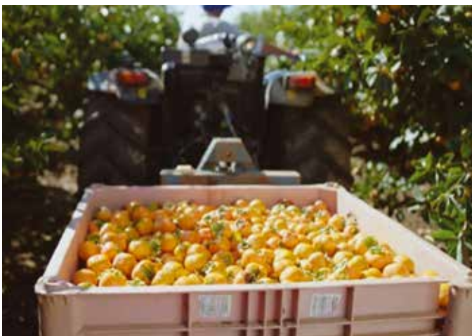
קטיף אפרסמון שפיים 2024

גודל מטע האפרסמון כיום הוא 160 דונם. לזה אנחנו מתכננים נטיעה של 100 דונם נוספים בסוף העונה הקרובה (קיץ 25) ובכך להרחיב את מטע האפרסמון. שטח הנטיעה החדש מתוכנן באזור שהיה "הר העפר" ממזרח לפסי הרכבת וכבר כיום עוסקים שם בהכנת השטח והשבתו לגידולי חקלאות.