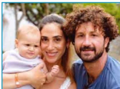
אורמל נלגס עידוד