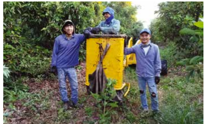
קטיף האבוקדו שפיים 2024

התוצאות מעלות סימן שאלה לגבי המשך כדאיות של גידול הבננות בשפיים. נצטרך להתמודד עם השאלה הזאת כבר בסיום העונה הקרובה, ולבחון חלופות לגידול תחת בית רשת.